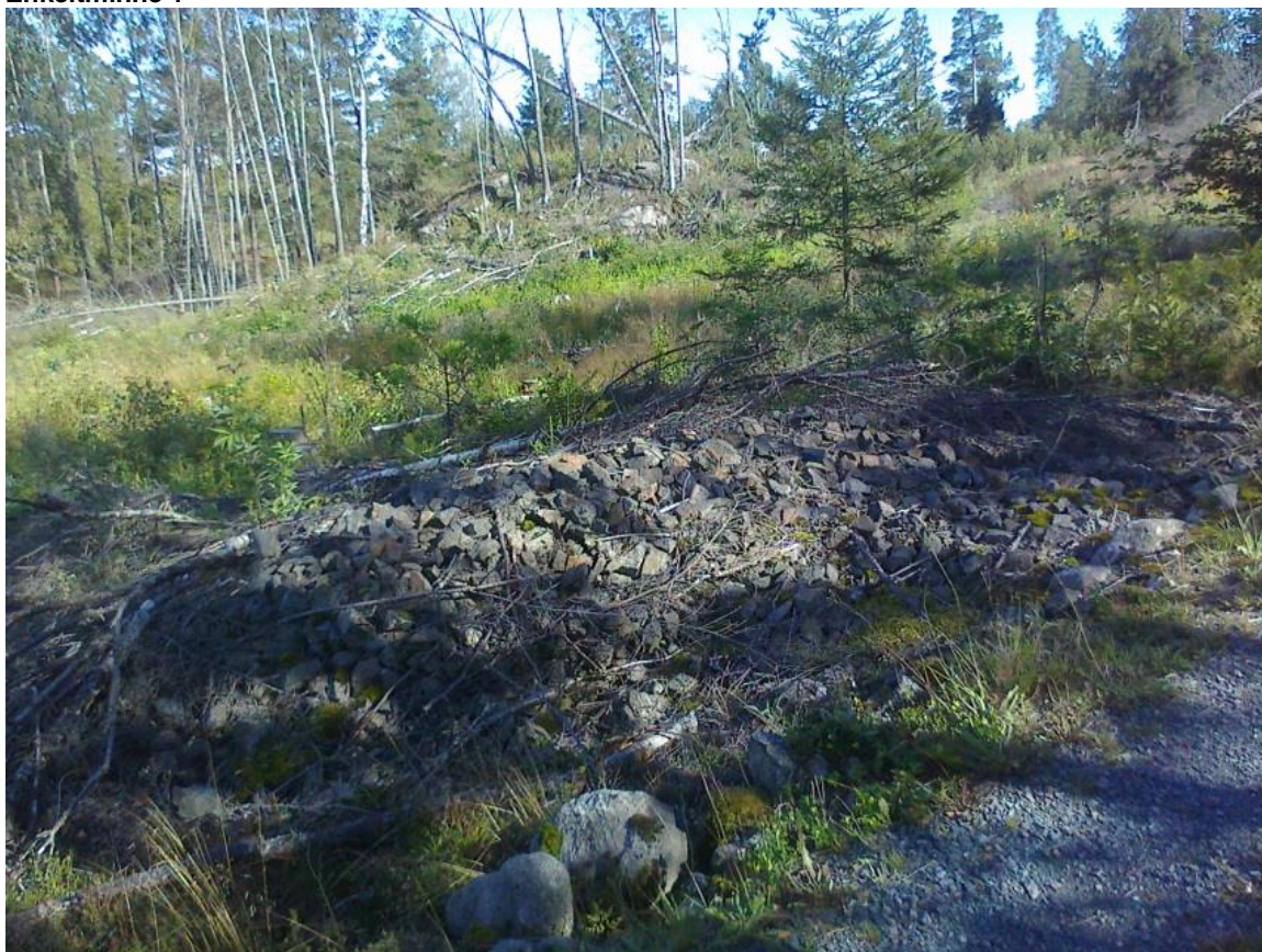
Figur 1: Jernmalm fra gruveindustri (SOSI-kode B0504 6 ), Husebykollen.

Dimensjon: Lengde ca. 10 m, høyde ca. 1 m.