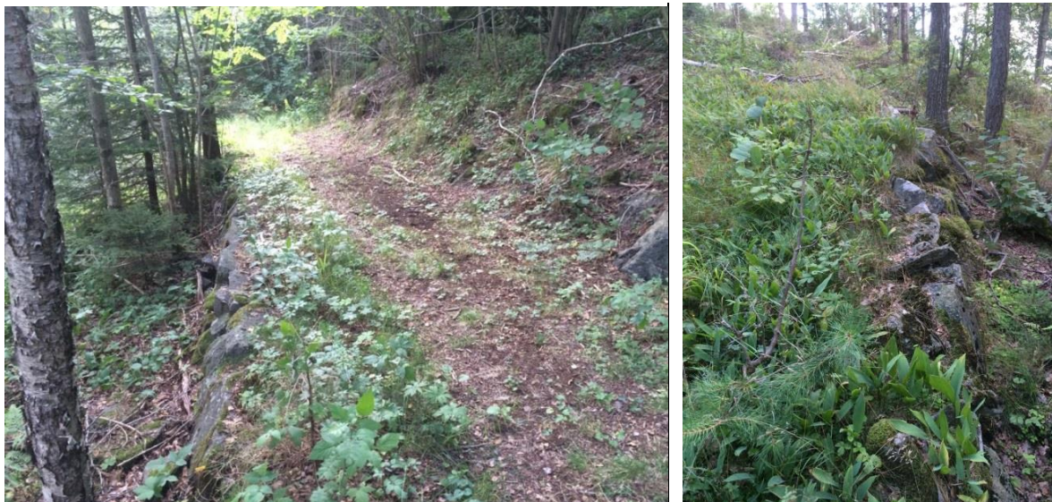
Figur 4: Steinsatt veikant for kjerrevei (SOSI-kode D5101). Posisjon: Se kart i Vedlegg 1. Lengde (avlest fra kart): Ca. 500 m.