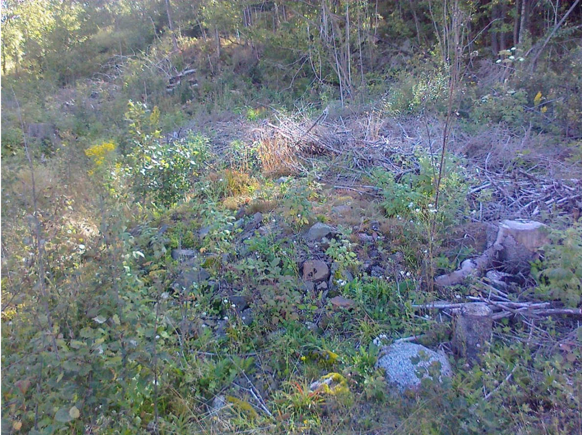
Figur 2: Jernmalm fra gruveindustri (SOSI-kode B0504), Husebykollen.

Dimensjon: Diameter ca. 5 m, høyde ca. 0,5 m.