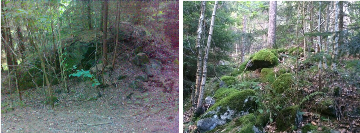
Figur 3: Jernmalm fra gruveindustri (SOSI-kode B0504), Husebykollen.

Dimensjon: Diameter ca. 10 m, høyde ca. 2 m.