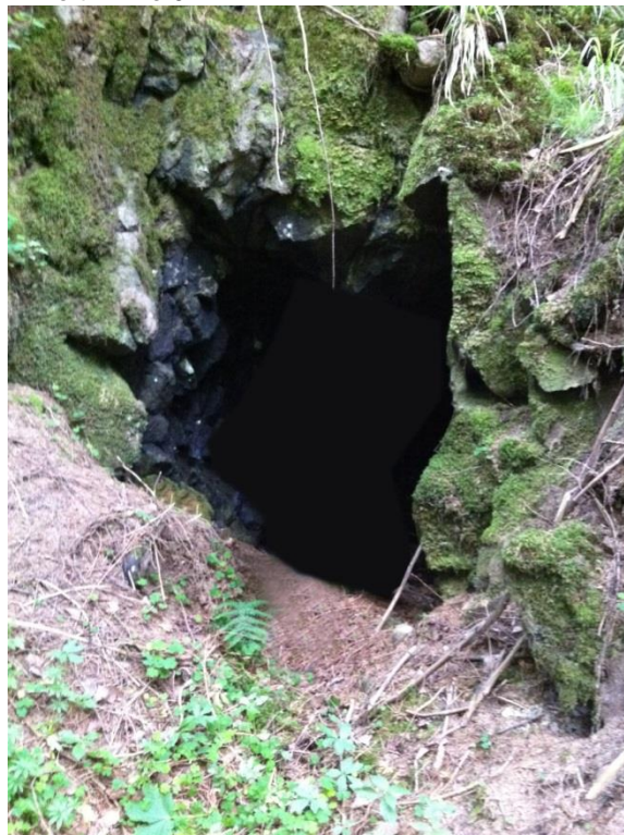
Figur 6: Innslag for malmuttak (ikke verifisert). Dimensjon: Høyde ca. 1,5 m, bredde ca. 1,5 m, horisontal dybde ca. 1 m. Omtrentlig posisjon (avlest fra kart): UTM33 6613222N, 251140Ø; 59°34'57,456"N, 10°35'29,709"Ø. Utenfor kartet i Vedlegg 1.