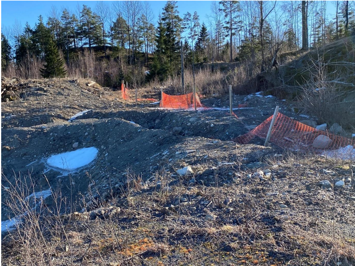
Mangelfull sikring av pukkverk