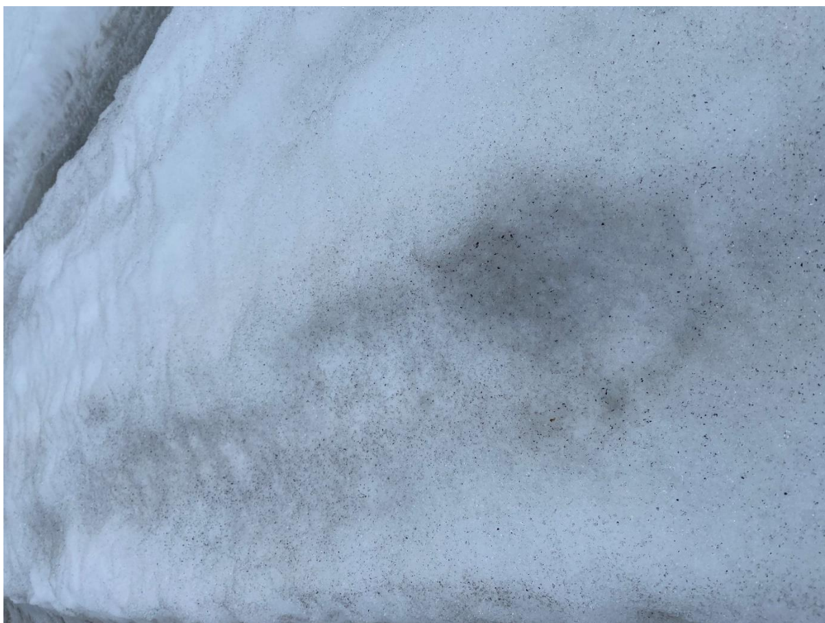
Støv i snøen to uker etter siste snøfall