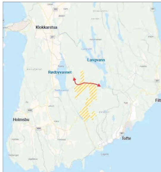
GJERDES INN: Asker kommune la nylig ut dette kartet, hvor det skraverte området skal vise områdene som er foreslått inngjerdet og utilgjengelig for allmenheten.

– Hva vil du si veier mest i denne saken fra Askers ståsted? – Sikkerhet for omgivelsene, miljøhensyn, transportavstander, tap av natur og friluftsliv. Det er betryggende at Miljødepartementet allerede er koblet