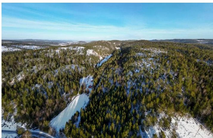
STORT OMRÅDE: Her sett nordover mot Avgrunnsdalen.

- Ja, men man jo se på om det er mulig for eksempel å legge dette et annet sted der det kanskje er nedlagt industri, såkalte «grå arealer». Det må i hvert fall være mulig å ikke legge det midt i et av de viktigste friluftsområdene i en kommune med 100 000 innbyggere, men heller i et lite brukt område, uten naturskog.